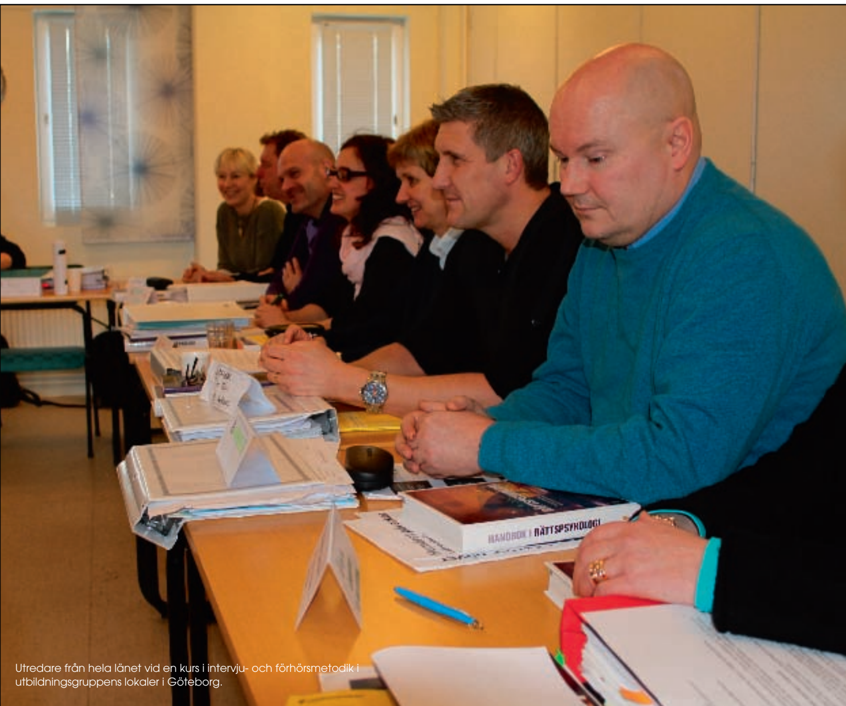
Utredare från hela länet vid en kurs i intervju- och förhörsmetodik i utbildningsgruppens lokaler i Göteborg.

personal, som till exempel självskydd och kommunikation, skjutträning och användning av OC-spray, men också utbildningar inom arbetsmiljöområdet för chefer och skyddsombud, vilket styrs av arbetsmiljölagen.