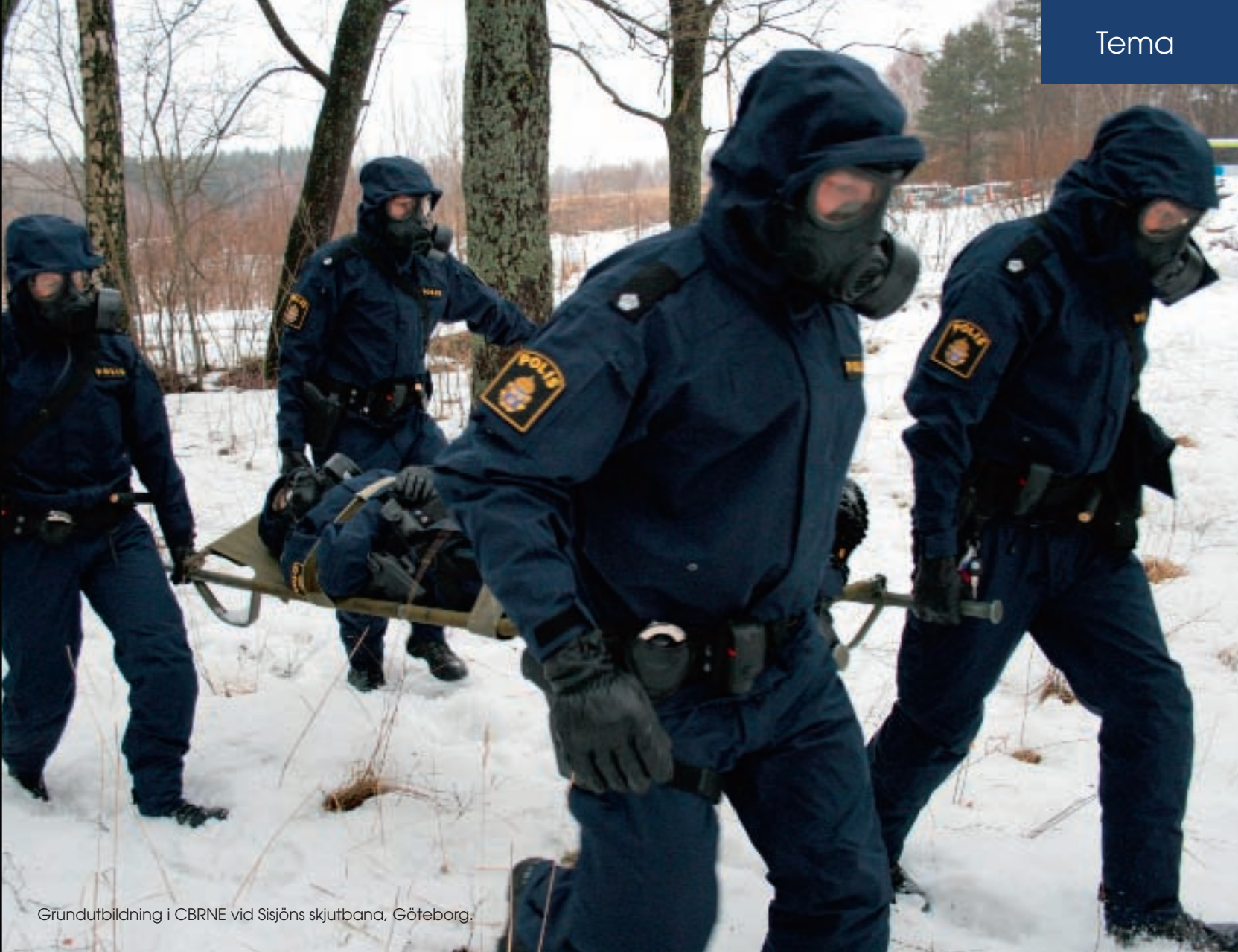
Grundutbildning i CBRNE vid Sisjöns skjutbana, Göteborg.

Det gäller att vara lyhörd för vad som sker i myndigheten och lyssna på synpunkter från områden och avdelningar om vad som fattas utbildningsmässigt. Dessutom jobbar gruppen bland annat med att kvalitetssäkra utbildningarna och att få till lämpliga kunskapsprov efter genomförda kurser.